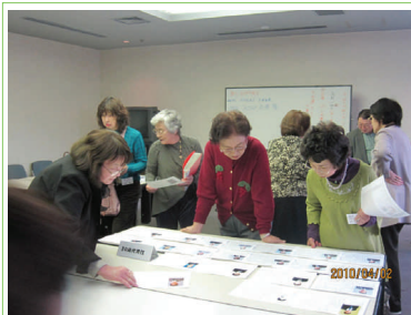
地道な努力が成婚のカギですね