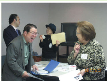
笑顔いっぱい幸せの相談です