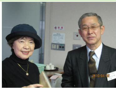
支部長同士で仲良く情報交換！