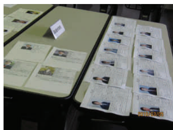
会員様のプロフィールがズラリ！