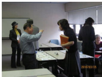
先生方のプレゼンも力が入ります