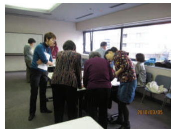
会員様のために相談も真剣です